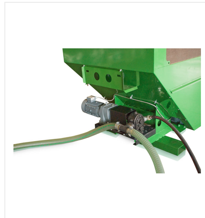
Pompe d'aspiration et tuyau de dérivation