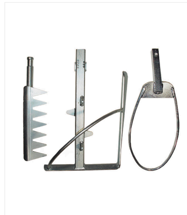
Outil de mélange spécifique garantissant un mélange homogène