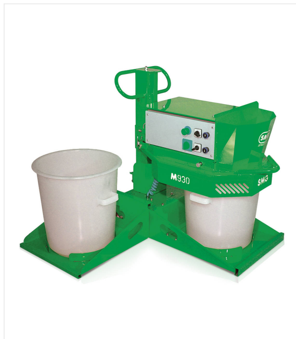
Tête de mélange à abaissement hydraulique jusqu'à la hauteur de travail