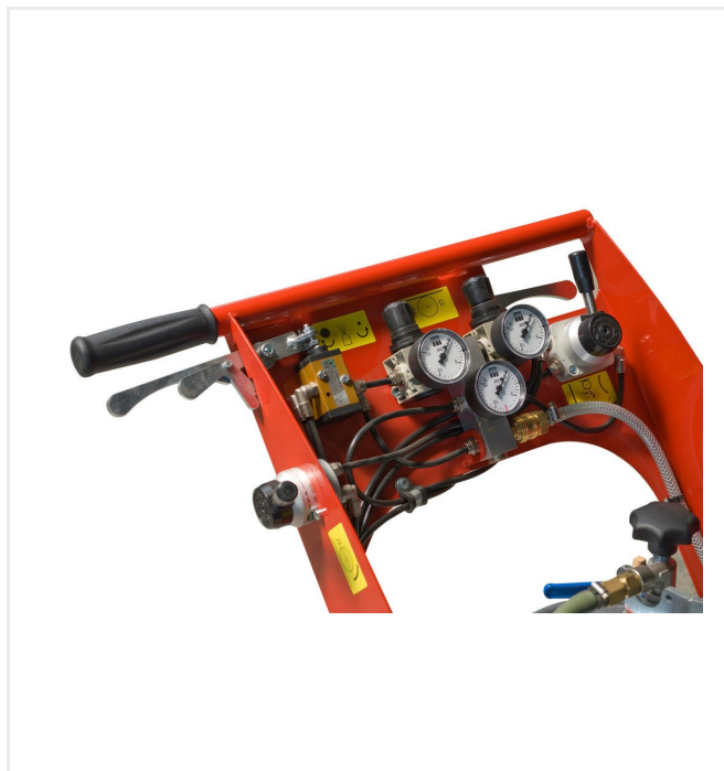
Commande pneumatique de toutes les fonctions, disposées clairement