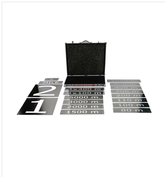
Set de pochoirs - Marquages et numéros