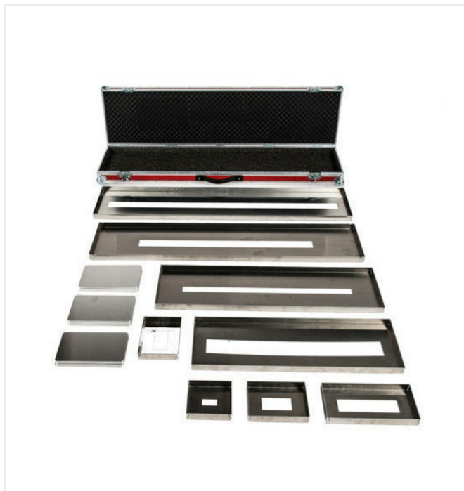
Set de pochoirs - Lignes