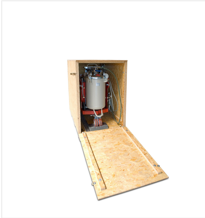
Caisse de transport SMG compacte avec dispositifs de fixation