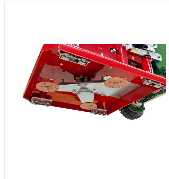
La disposition particulière des disques en carbure évite les traces d'abrasion

Ce réglage détermine la profondeur de matériau retiré