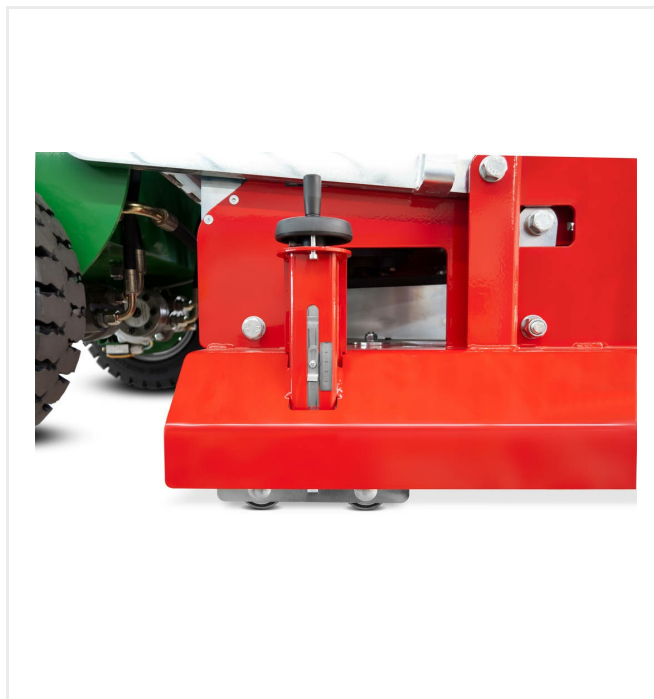
La profondeur de travail est ajustée avec précision par 4 guides de réglage.

Ce réglage détermine la profondeur de matériau retiré