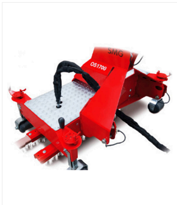
עם מערכת חיבור בעלת 3 נקודות אחוריות, הנעה הידראולית