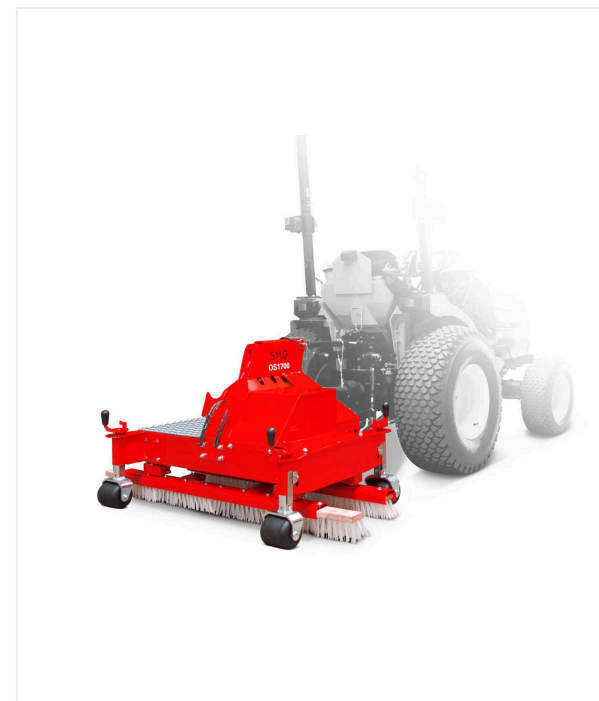
מברשת מסתובבת OS1700/OS1700 PTO