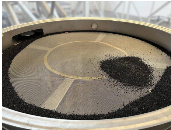
מערכת ניפוי סיבובית