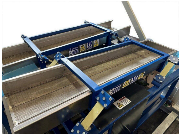
מערכת סחיטה רוטטת