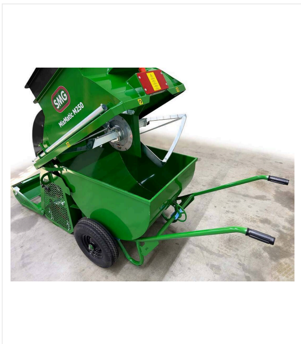
Dwukołowa taczka z wywrotką, możliwość zawieszania jako pojemnik do mieszania