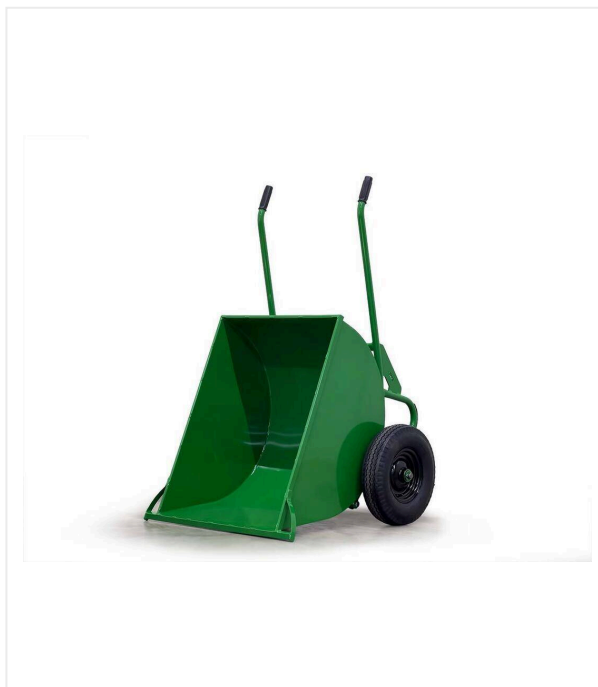
Dwukołowa taczka z wywrotką