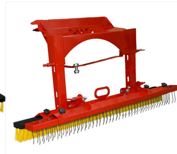
Szcotka do ściągania / szcotka dekompaktująca - z montażem z tyłu