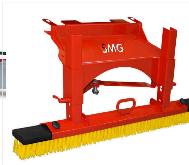
Szcotka ściągająca - montowana z tyłu

Listwa magnetyczna do pielęgnacji sztucznej murawy.