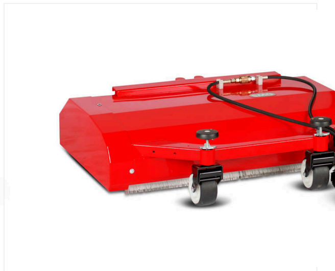
Szczotka podwójna PGD900

Rozrzutnik do mocowania z tyłu z układem kołowym do sztucznej trawy.