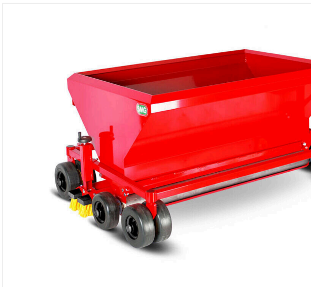
Rozrzutnik 1400 mm