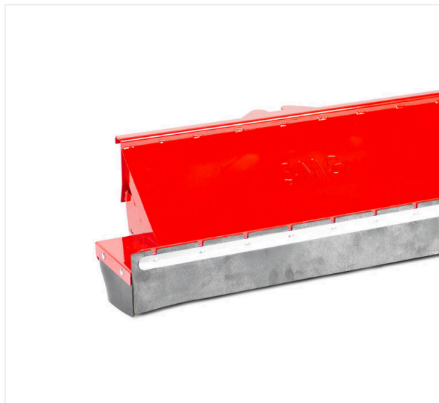
Listwa do odkurzania liści