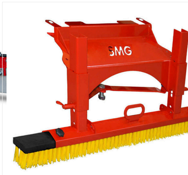
Szcotka ściągająca - montowana z tyłu

Listwa magnetyczna do pielęgnacji sztucznej murawy.