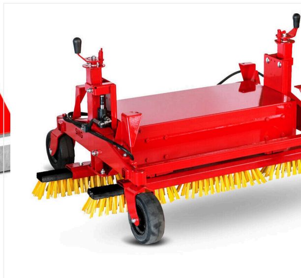
OS1100 Szczotka oscylacyjjna