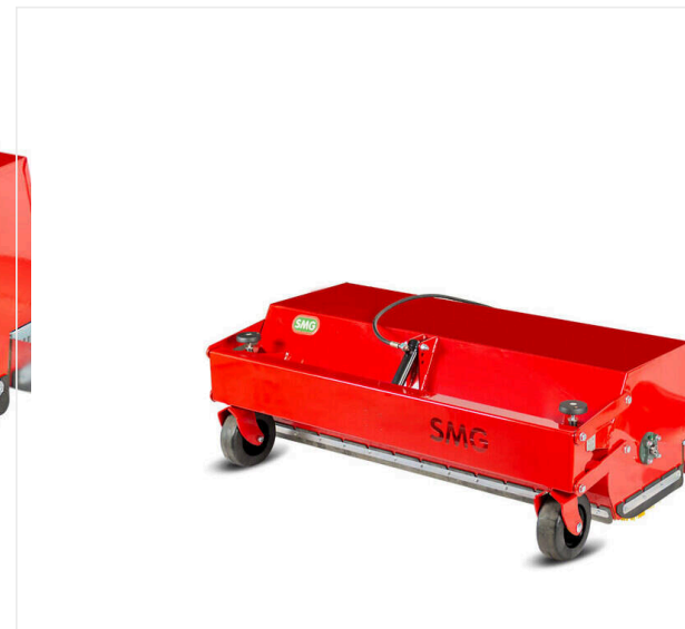
Szczotka rotacyjna 1.500 mm