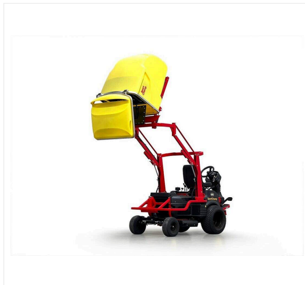
Opróżnianie zbiornika na wysokim poziomie

Umożliwia wygodne opróżnianie do pojemników.