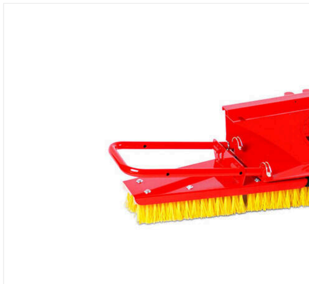
Szczotka wczesująca - montowana z przodu