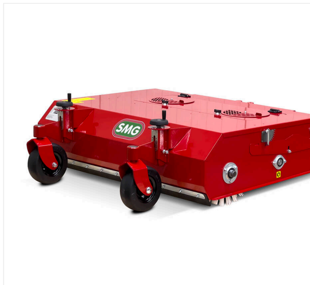
Szczotka rotacyjna 1.100 mm