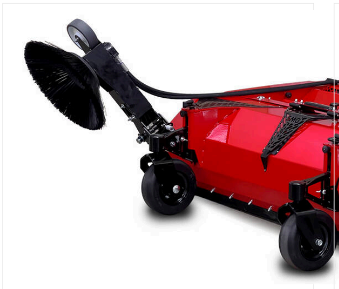
Szczotka rotacyjna SC3