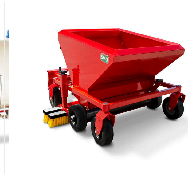
Rozrzutnik 800 mm