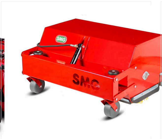
Szczotka rotacyjna 1.000 mm