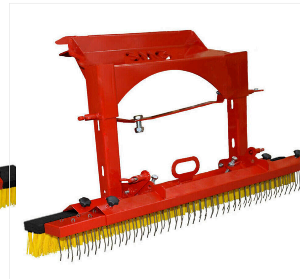
Szcotka do ściągania / szcotka dekompaktująca - z montażem z tyłu