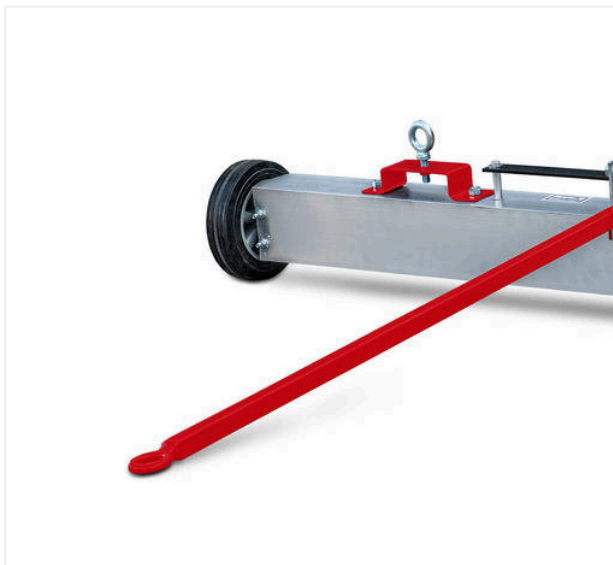
Listwa magnetyczna ML1500