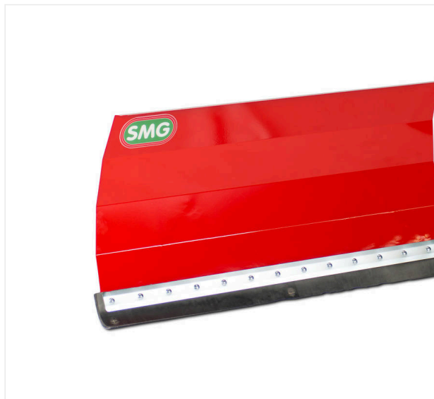
Pług do śniegu