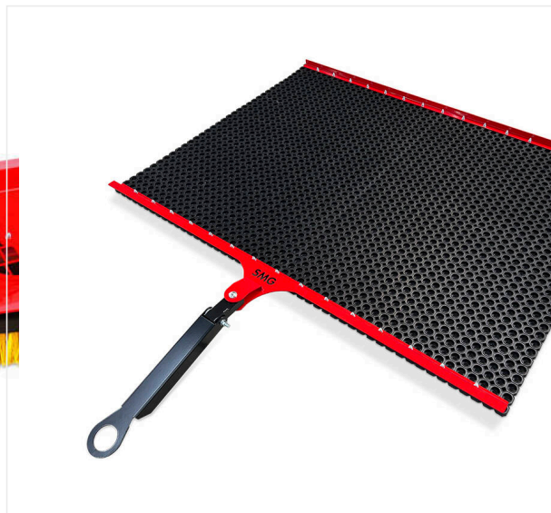
Gumowa mata wygładzająca