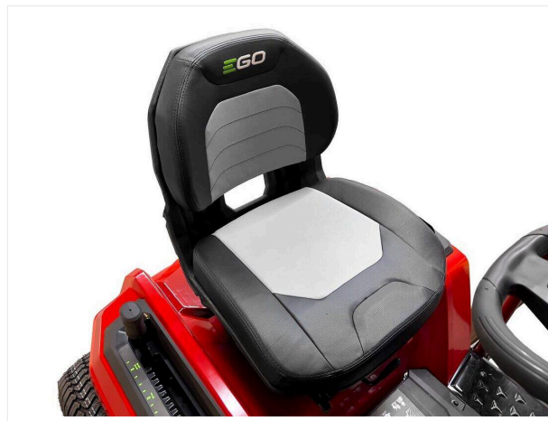
Komfortowy Amortyzowany i regulowany fotel kierowcy.