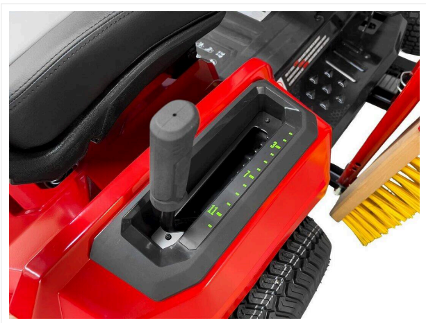
Łatwy w obsłudze