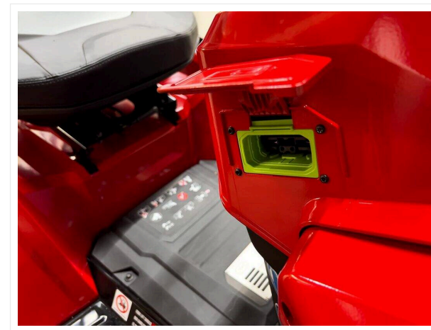
Praktyczny podłączenie do bezpośredniego ładowania akumulatorów.