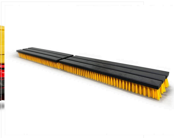
Optional rows of brushes

Maszyna z siedziskiem do czyszczenia i pielęgnacji sztucznej trawy. Dla klubów lub szkół.