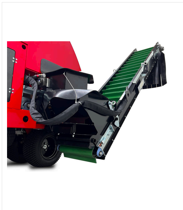
Taśma przenośnikowa, przechylenie 180°

Do transportu w ramie transportowej, łatwy do zamocowania.