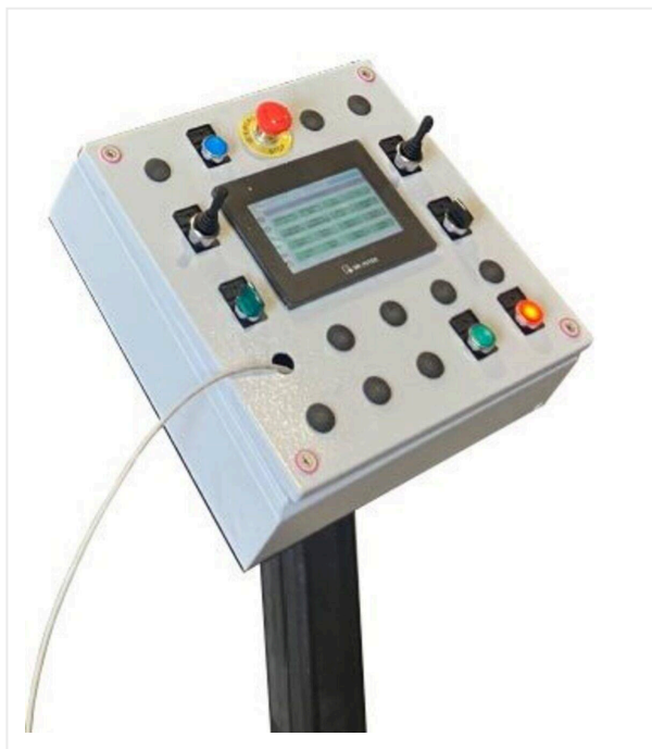
Центральная панель управления