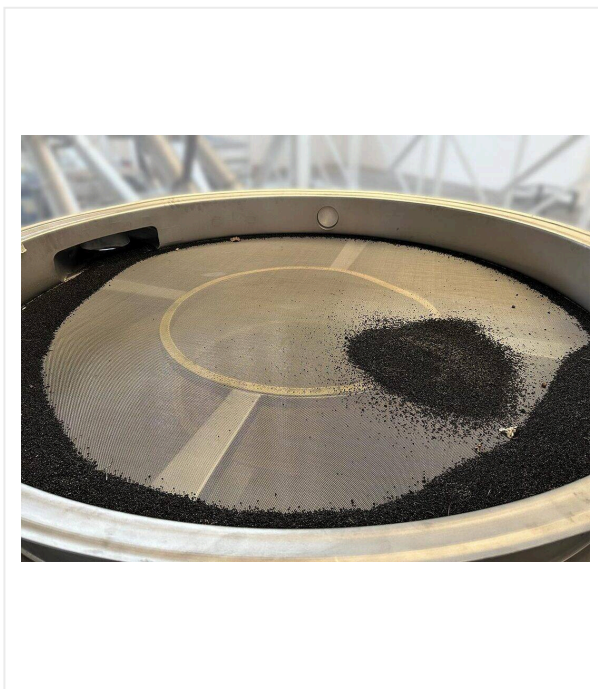
Барабанная система сортировки