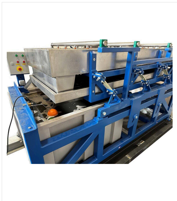
Система мокрого просеивания