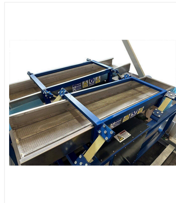
Вибрационная система обезвоживания