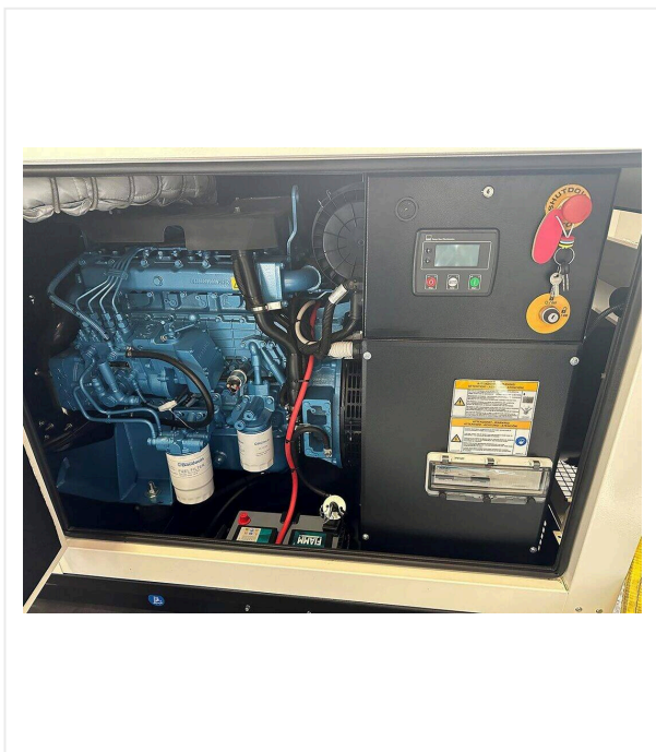
Генератор мощностью 65 кВт·ч дизельный или бензиновый