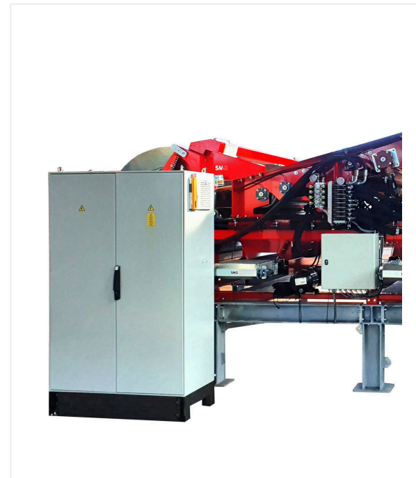
Распределительный блок с органами управления