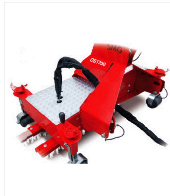
С 3-точечной задней навесной системой, гидравлический привод