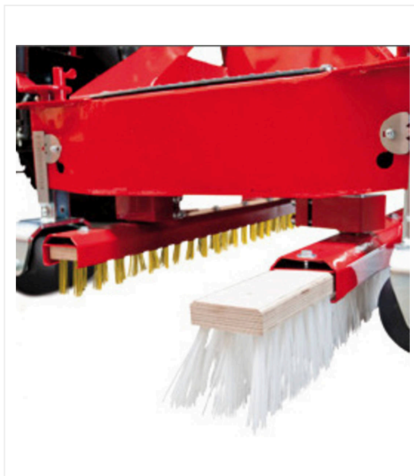
Имеются щётки различной жёсткости для любых требований, легко заменяемые.