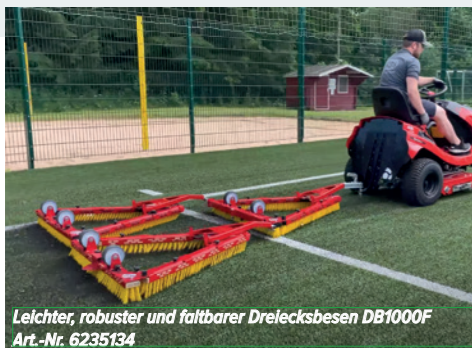
Leichter, robuster und faltbarer Dreiecksbesen DB1000F Art.-Nr. 6235134