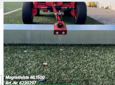
Magnetleiste ML1500 Art.-Nr. 6220297