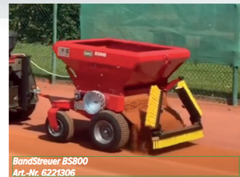
Bandstreuer BS800 Art.-Nr. 6221306